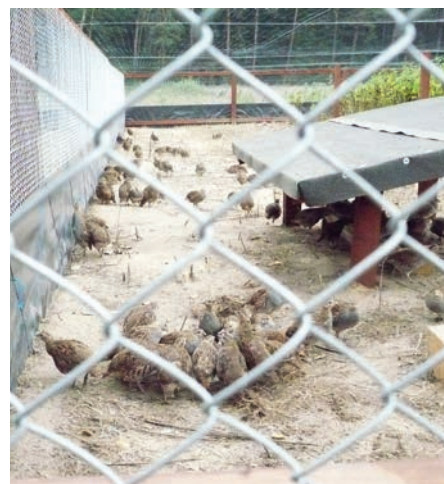
Kuropatwy w wolierze adaptacyjnej, s. 4