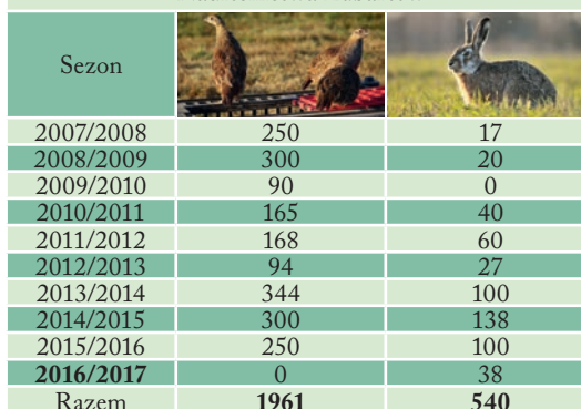
Wsiedlenia zwierzyzny drobnej w OHZ-tach Nadleśnictwa Lubartów

Do spadku liczebności przyczyniła się w znacznym stopniu presja drapieżników – dzikich ssaków (lis, jenot, kuna) i ptaków (kruk, sroka, jastrzębiowate). Wskazać trzeba również na penetrację terenów porolnych zarówno przez zdziczałe psy i koty, jak i te utrzymywane w gospodarstwach wiejskich. Główny specjalista ds. łowiectwa w lubelskiej RDLP przywołuje badania przeprowadzone przez magistranta z Katedry Ekologii i Zwierząt Łownych Uniwersytetu Przyrodniczego w Lublinie: – Wykazały one, że na jedno gospodarstwo wiejskie, sąsiadujące z miejscem bytowania zwierzyzny drobnej, przypada średnio 1,5 psa i 1,8 kota. W porze nocnej 70% tych psów jest wypuszczana samopas.